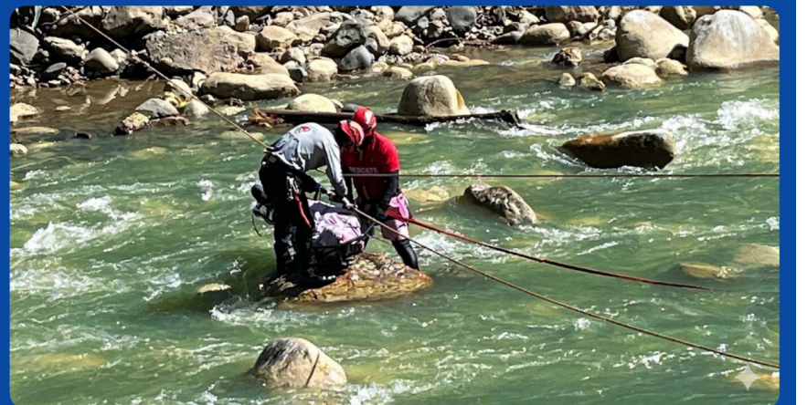
Policías de Emergencia y Rescate lograron recuperarlo

RESCATAN CUERPO DE ANCIANO QUE CAYÓ AL RÍO SANTA