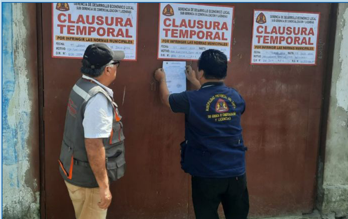
La Municipalidad Provincial del Santa (MPS) clausuró temporalmente cinco establecimientos comerciales en Chimbote por infringir disposiciones municipales relacionadas con los ho-

Los establecimientos funcionaban fuera del horario permitido o realizaban actividades para las que no contaban con autorización