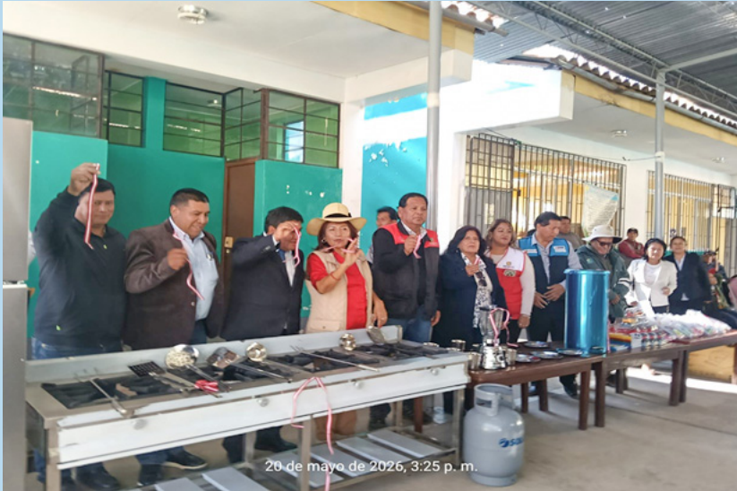
20 de mayo de 2026, 3:25 p. m.