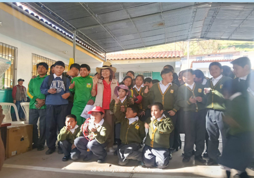
20 de mayo de 2026

Este logro no solo representa un reconocimiento, sino el reflejo de una comunidad que, unida, transforma realidades. El trabajo articulado entre la escuela, las autoridades, los docentes, los padres de familia y el personal de la posta de salud demuestra que cuando existe compromiso y visión compartida, es posible generar cambios reales y sostenibles. Andamarca se convierte así en un ejemplo inspirador de cómo la unión de esfuerzos puede marcar la diferencia, sembrando hoy las bases de un futuro más saludable, justo y prometedor para sus niños.