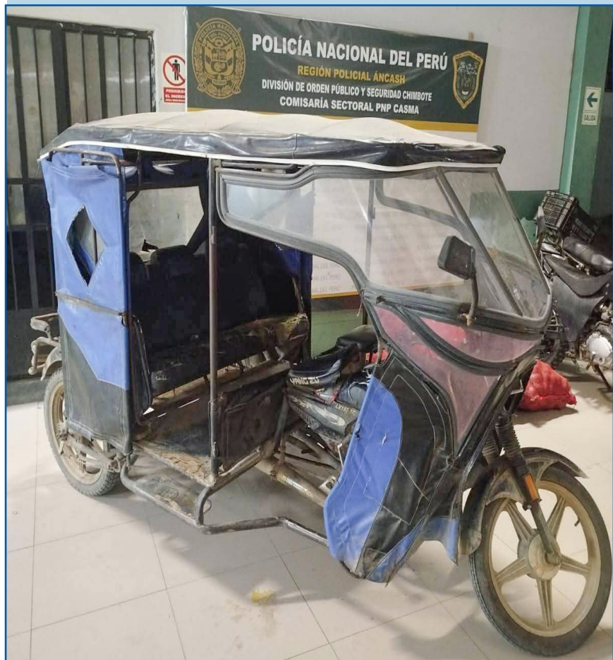
La Policía de la Comisaría de Casma recuperó productos hurtados e incautó