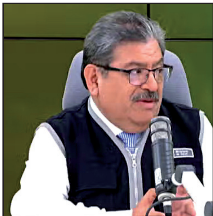
HENRY REBAZA - VICEMINISTRO DE SALUD PÚBLICA DEL MINSA

El Gobierno declaró emergencia sanitaria por 90 días por el brote de sarampión, debido a la transmisión local registrada en Puno y ante el riesgo de propagación hacia otras regiones del país.