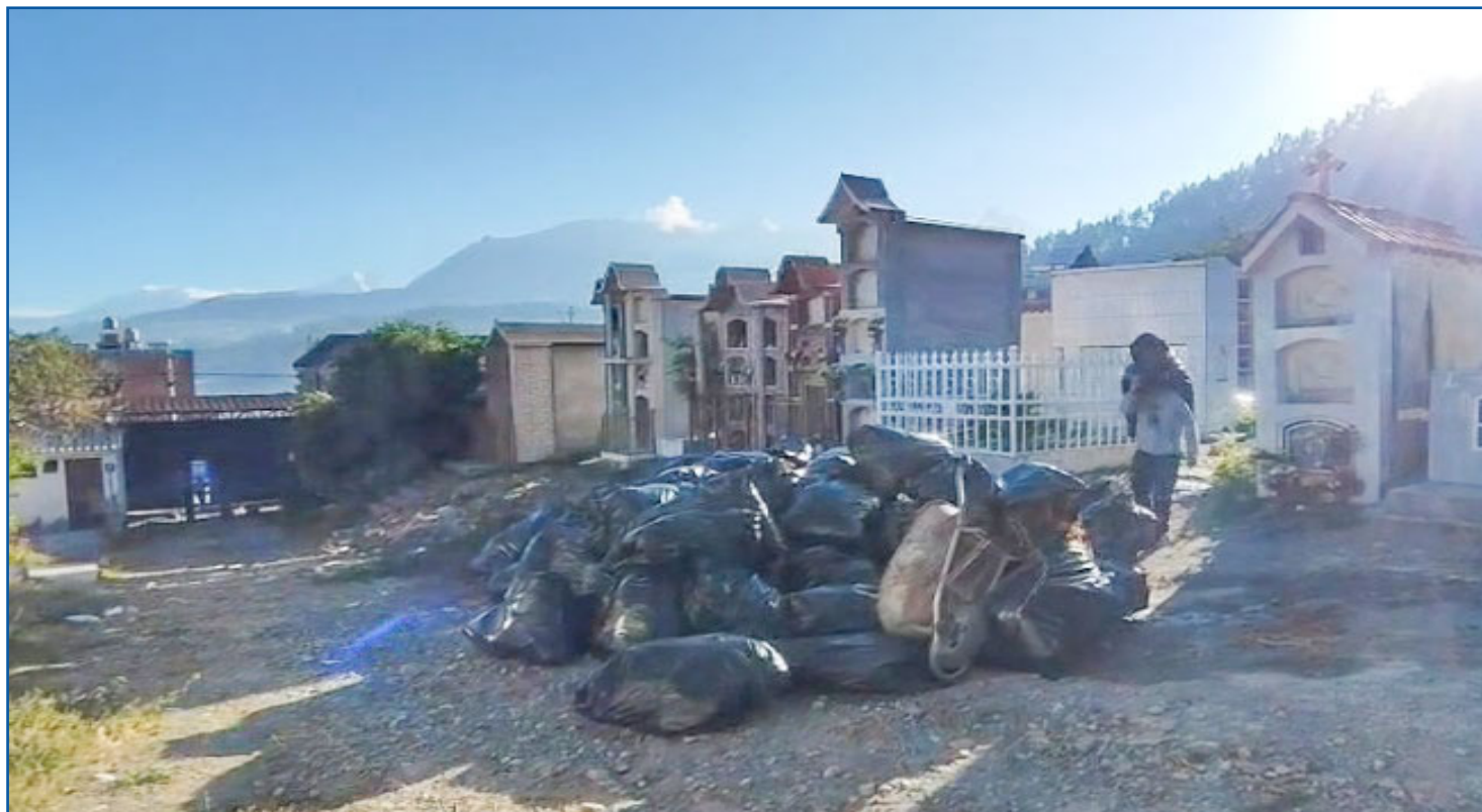
La Sociedad de Beneficencia de Huaraz, en marco a los 189 Aniversario Institucional ha programado la limpieza general en el Cementerio Presbítero Pedro García Villón de Huaraz, acción que se cumplió con gran participación de los trabajadores de la institu-

Como parte de las actividades limpiaron el cementerio de Huaraz