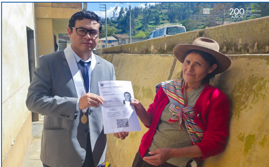
La Corte Superior de Justicia de Áncash (CSJAN)

Durante la jornada se beneficiaron usuarios de distintas provincias del distrito judicial de Áncash.