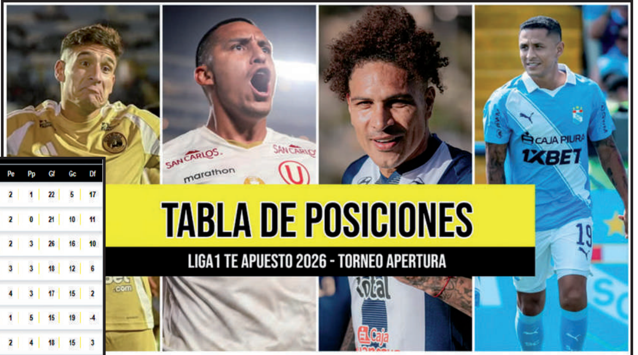
TABLA DE POSICIONES

Universitario de Deportes, vigente tricampeón del fútbol peruano, sueña con lograr el tetracampeonato nacional en la Primera División por primera vez en su historia, pero el camino para los cremas no será sencillo, pues deberán competir con diecisiete clubes más que quieren alcanzar la gloria en Liga1 Te Apuesto 2026.