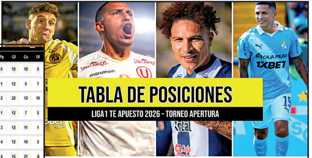
TABLA DE POSICIONES