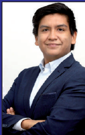
Por: Pedro Chirinos, jefe de asuntos legales y regulatorios de ComexPerú

Tenemos candidatos que van perfilándose, pero aún hay un porcentaje importante de indecisos, y muchos ya hablan de ausentarse.