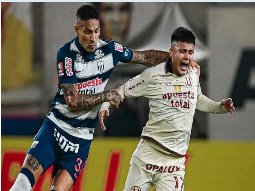
Por la novena fecha del Torneo Apertura, Universitario se impuso por 1-0