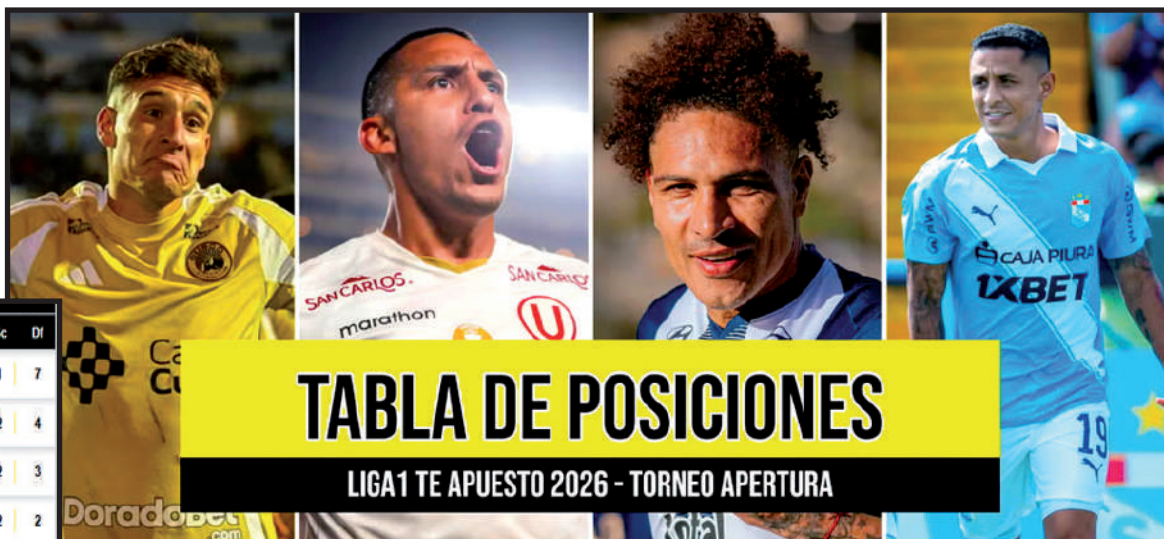
TABLA DE POSICIONES

La Liga1 2026 se divide en los torneos Apertura y Clausura. El campeonato mantiene el formato de