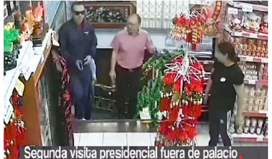
Segunda visita presidencial fuera de palacio.

Una nueva grabación difundida recientemente muestra al presidente José Jerí ingresando el 6 de enero de 2026 a un local comercial del jirón Paruro, en el Cercado de Lima, en una visita que no fue registrada en su agenda oficial ni reportada en los portales de transparencia.