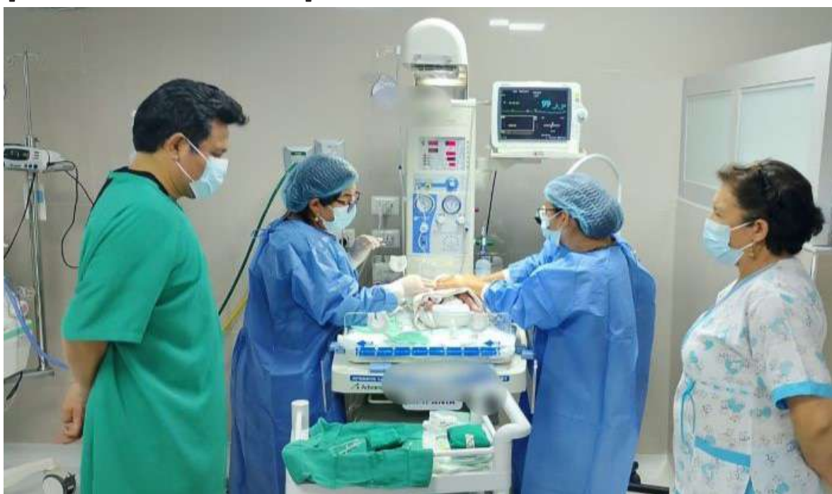
Esfuerzo conjunto. Especialistas del Hospital La Caleta, de Chimbote, y del Instituto Regional

El Hospital La Caleta y el Instituto Regional de Oftalmología sientan precedente en la cooperación interinstitucional del sector Salud.