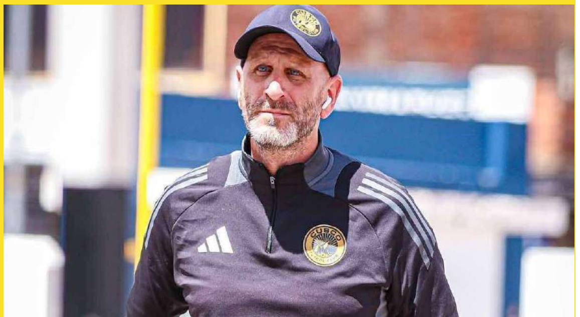
tó quién no seguirá la próxima temporada: "Te-