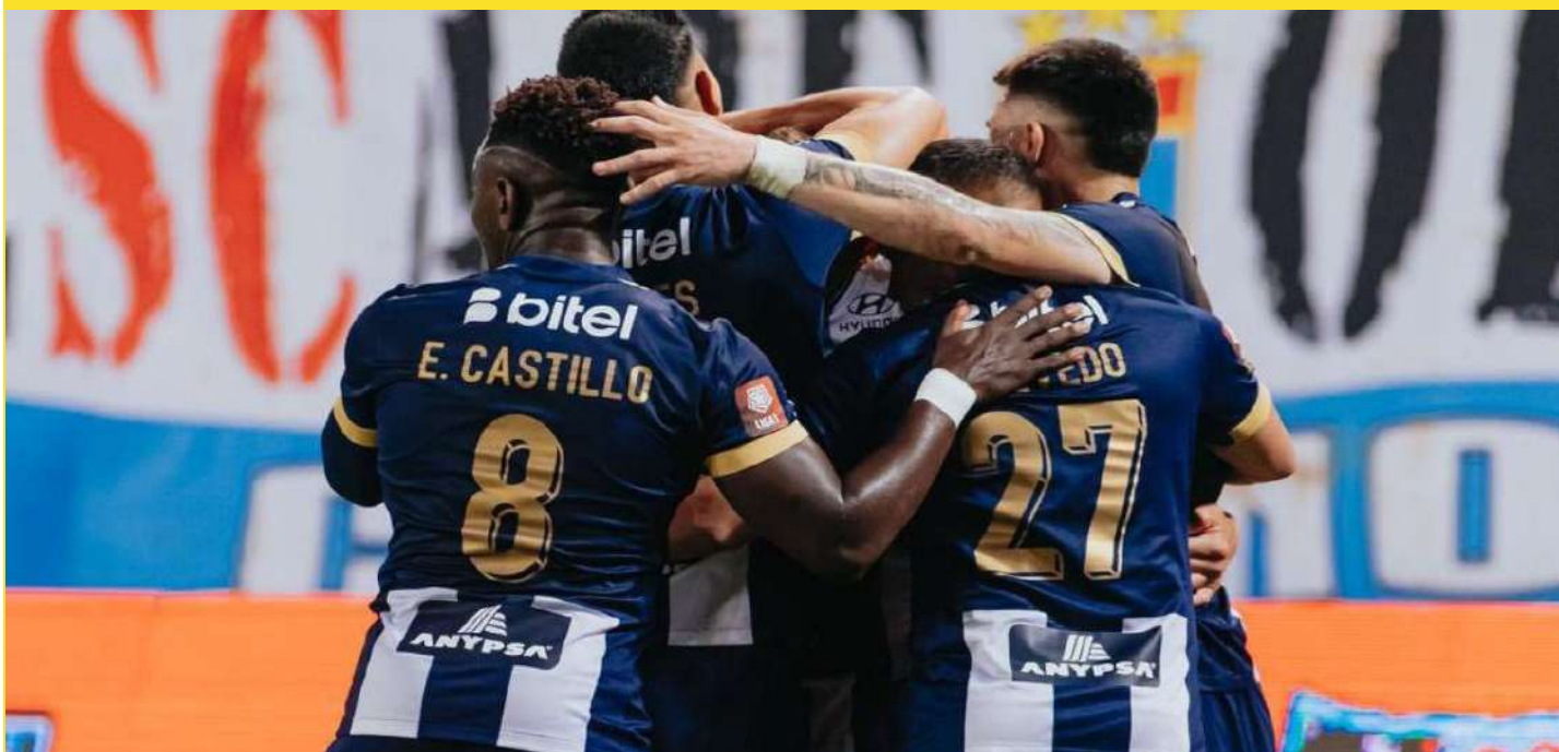
Mañana a partir de las 8:00 p.m., Alianza Lima