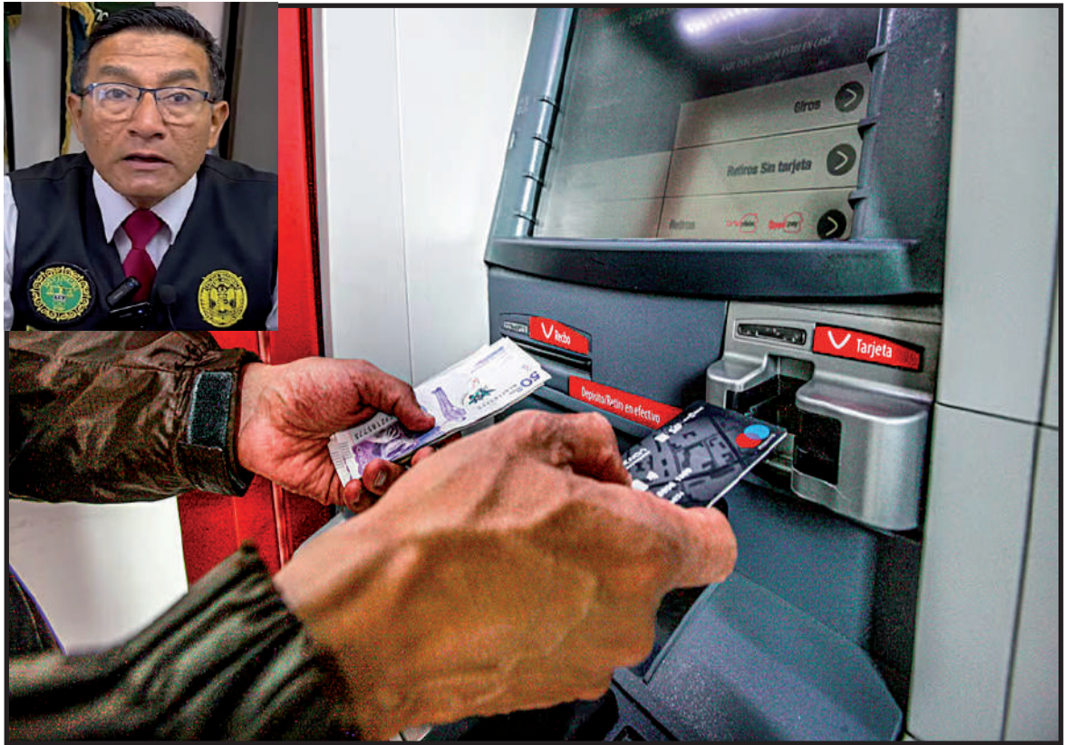
Redacción y foto: (Erick Loli - Central De Noticias Ancash)

La DIVINCRI reiteró que el mal vivir "pulula" en estas celebraciones y pidió a la ciudadanía mantenerse alerta para evitar caer en manos de organizaciones delictivas.