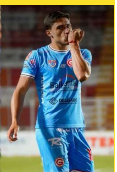
una de las plazas más representativas del fútbol