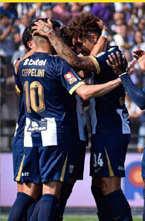
las llaves de los playoffs en los que Cusco FC, Alianza Lima y Sporting