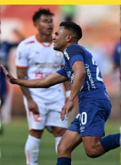
ticipación internacional y mantener al Cusco como