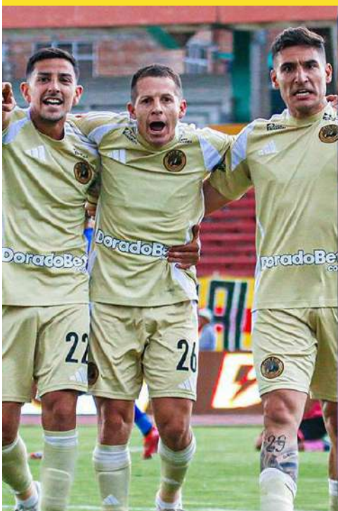
Se jugó la última jornada del Torneo Clausura y ya se conocen