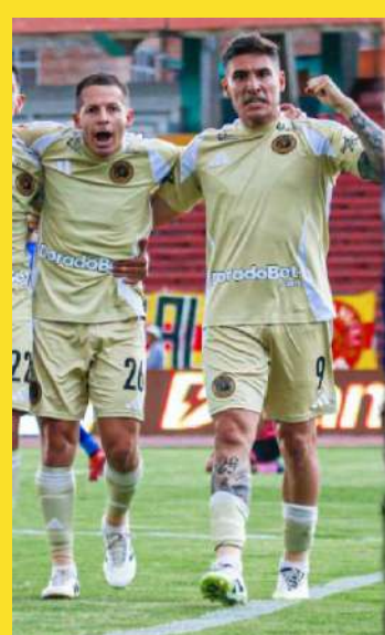
cerró una temporada sólida que le permite repetir par-

Finalmente, Deportivo Garcilaso también dirá presente en la Copa Sudamericana tras finalizar en la séptima casilla con 52 unidades. El elenco celeste