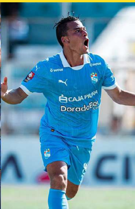
El elenco imperial terminó en segundo lugar