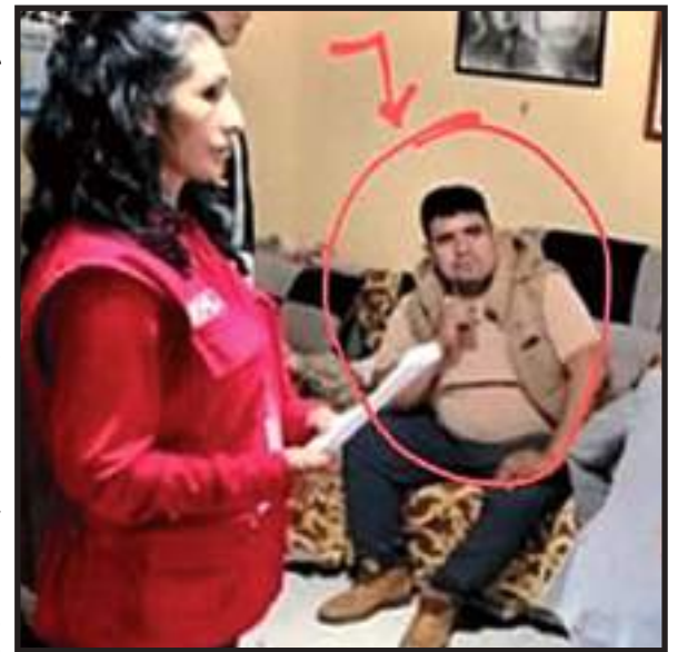
TESORERA SE SALVA DE LA CÁRCEL

La Fiscalía continuará con las diligencias correspondientes para avanzar en la investigación y determinar el grado de implicancia de los investigados en este presunto caso de corrupción.