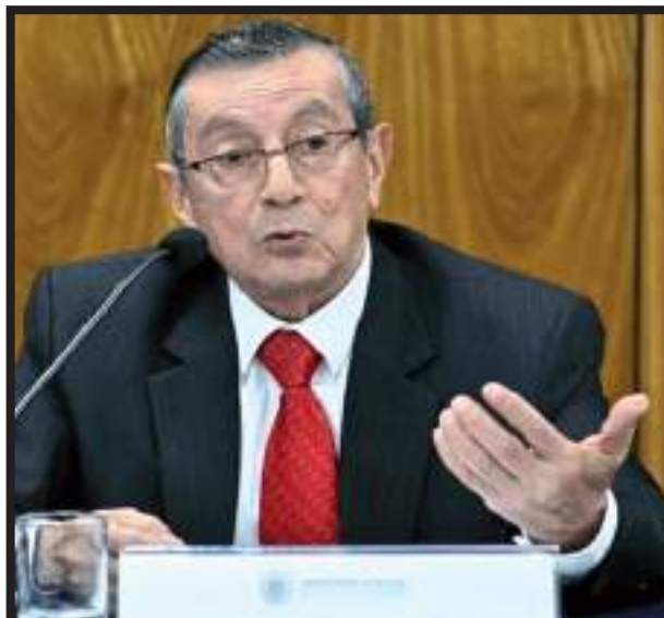
(César Romero Calle - larepublica.pe)