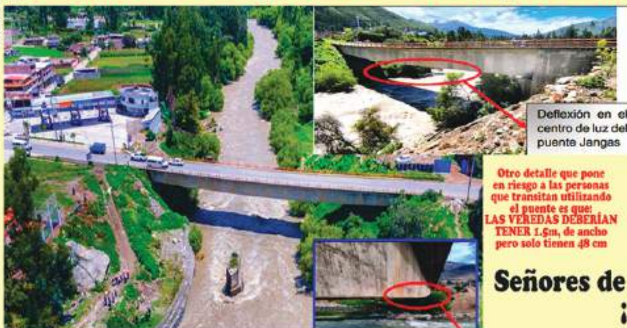
Deflexión en el centro de luz del puente Jangas

Otro detalle que pone en riesgo a las personas que transitan utilizando el puente es que: LAS VEREDAS DEBERÍAN TENER 1.5m, de ancho pero solo tienen 48 cm