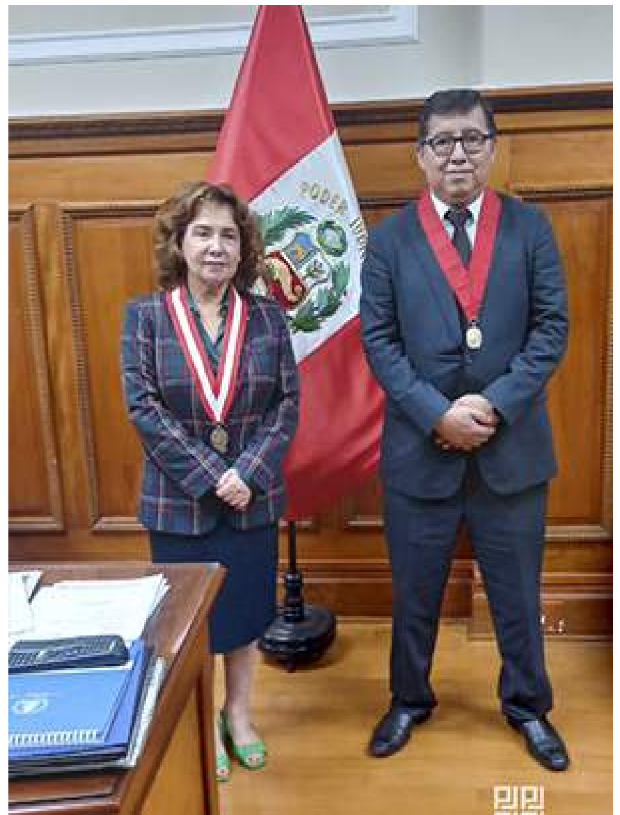
Los presidentes y presidentas de las Cortes de Justicia se reúnen en Lima