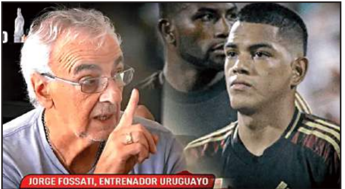
JORGE FOSSATI, ENTRENADOR URUGUAYO

El veloz exatacante de Sporting Cristal afronta un momento complicado en el balompié serbio. Desde hacer algunos días, algunos medios indicaron que el peruano ya no seguiría en el FK Partizán debido a su bajo