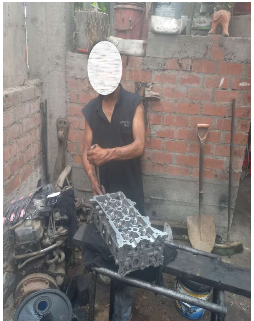
Conocido mecánico tomó fatal decisión de quitarse la vida por la soledad que lo abrumaba