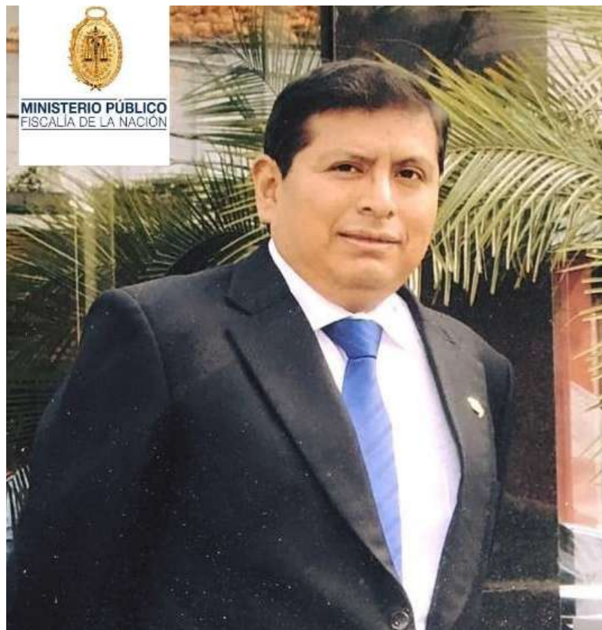
MINISTERIO PÚBLICO FISCALÍA DE LA NACIÓN