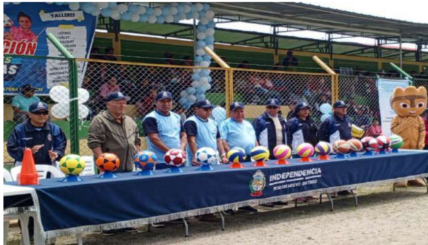
Con diversas actividades llegó a su final la conmemoración del 159 Aniversario de Creación Política del Distrito de Independencia (Huaraz-Ancash), sin em-

En Independencia niños y adolescentes participan de 14 disciplinas