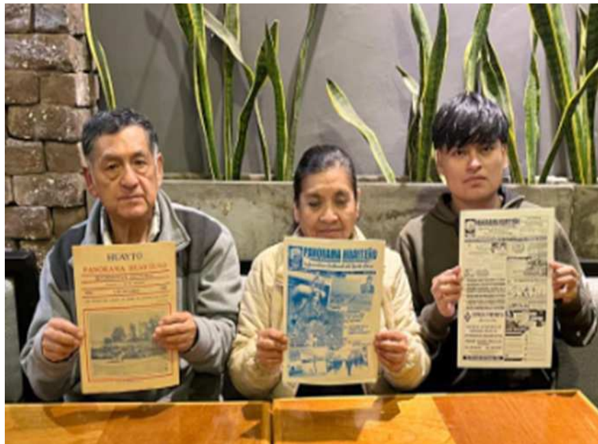
Foto del recuerdo por los 38 años de fundación de la revista panorama huayteño que cumplió este 7 de octubre. Dicha revista fue fundada un 7 de octubre de 1986 en homenaje a la santí-