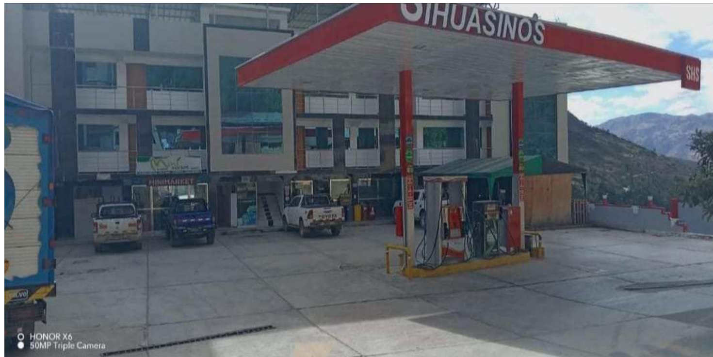
○ HONOR X6 ● 50MP Triple Camera