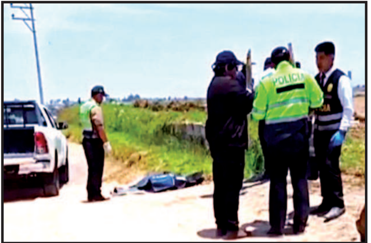
El día 30 de Mayo del 2024 la PNP de Pampas, fueron alertados sobre el hallazgo del cadáver de una anciana de 79 años de edad, por lo que el Ministerio Público, personal policial, la Juez de Paz de Pampas y la médico de turno del Centro de Salud de Pampas se constituyeron al lugar de los hechos para el levantamiento del cadáver, observando la médico que la occisa fue víctima de violación sexual y homicidio.