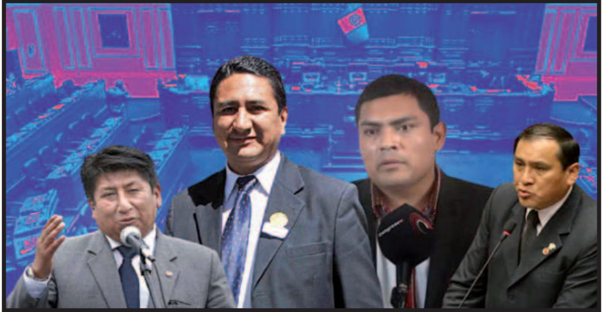
Congreso ratifica 'Ley impunidad' que ayudó a Vladimir Cerrón, Alejandro Soto y Martín Vizcarra en sus procesos

Luego del recorrido histórico-jurídico, lo más importante del documento se encuentra en la página 18, en el punto 27.