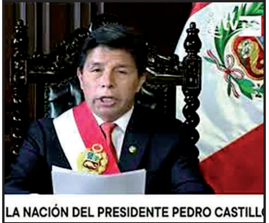
LA NACIÓN DEL PRESIDENTE PEDRO CASTILLO

Uno que se perfila con tono crítico Pedro de los (casi) 500 días de Carlos Basombrío —aún no lo