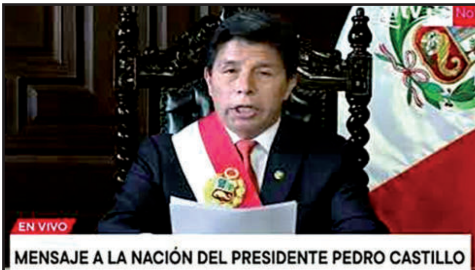
EN VIVO MENSAJE A LA NACIÓN DEL PRESIDENTE PEDRO CASTILLO