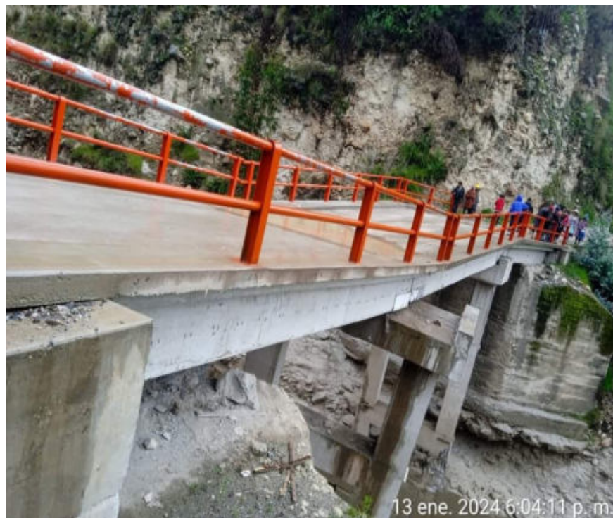
13 ene. 2024 6:04:11 p. m.