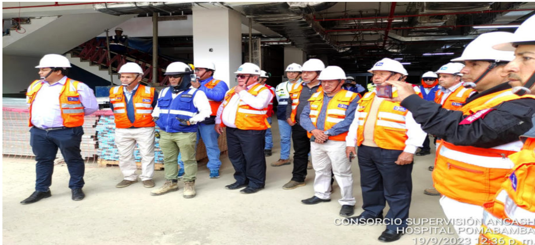
CONSORCIO SUPERVISIÓN ANCASH HOSPITAL POMABAMBA 19/9/2023 12:36 p. m.