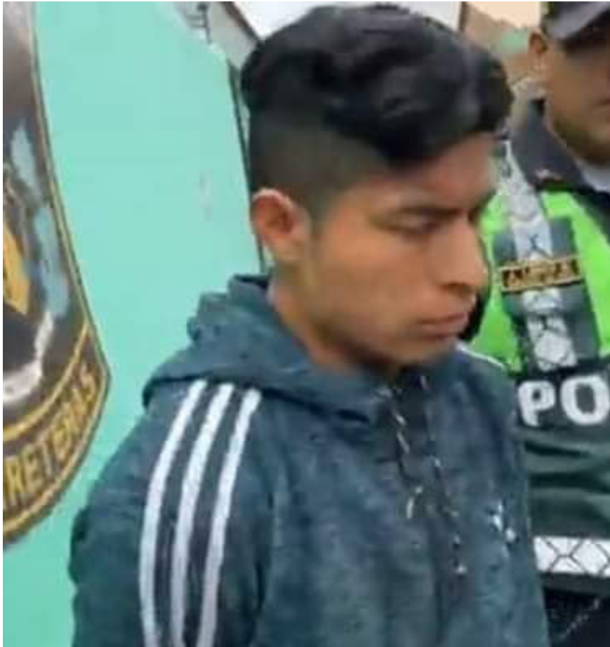
Agentes de la Policía detuvieron a dos sujetos cuando, mediante la modalidad del 'patinaje', sustraían un televisor de