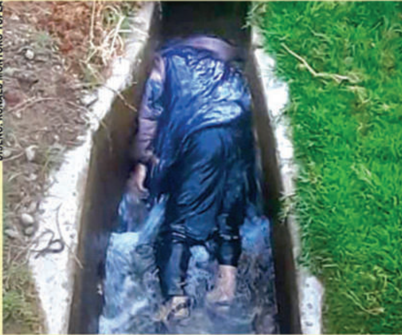
Canal de regadío pasa cerca de la puerta del colegio “José María Arguedas” en Chavín (Independencia), allí el cuerpo quedó atascado, y rescatado por los Serenos de Independencia con presencia del fiscal