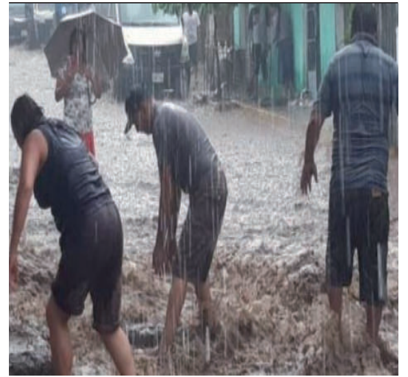
norte, sin descartar lluvias intensas especialmente en la región noroccidental del país. (Chimbotenlinea)

Para el verano de 2024, bajo el escenario de El Niño costero, es probable la ocurrencia de lluvias por encima de lo normal en la costa norte y la sierra