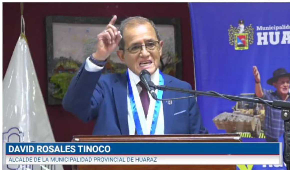
DAVID ROSALES TINOCO ALCALDE DE LA MUNICIPALIDAD PROVINCIAL DE HUARAZ