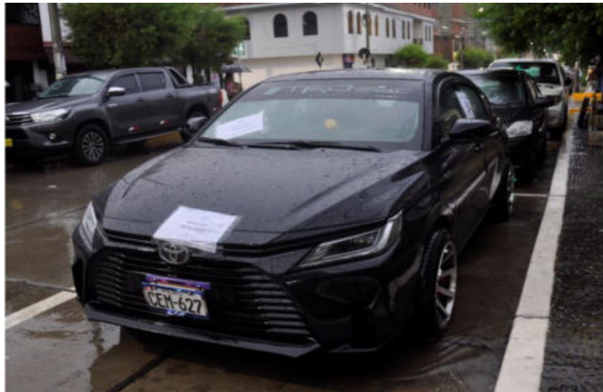
El coronel PNP José Santillán, dio cuenta de la intervención, desarticulación y detención de dos de los integrantes de una presunta banda criminal autode-

Son investigados por asalto a empresario a quien le robaron 80 mil soles