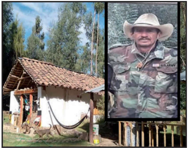
fundo "Rancho Bastiand" en el caserío de Cuzhuru, desde donde fue conducido al hospital, pero llegó ya sin vida. Se investiga. (Araldo Mejía Bojórquez)

Este hecho es investigado por la Policía, toda vez que el fallecido tenía el arma de fuego en el cinto y el disparo en el estómago fue mortal. Se explica que el fallecido es un ex miembro de las fuerzas policiales (Benemérita Guardia Civil del Perú) quien vivía solo en su