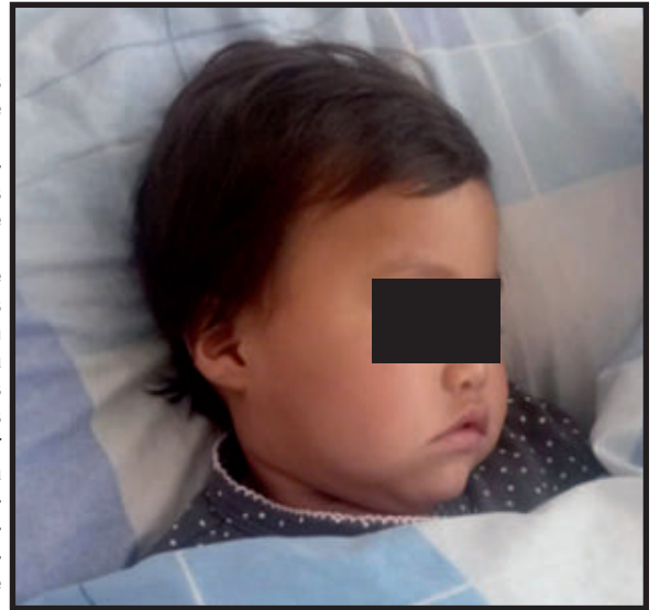
permite dar calidad de vida a la menor abandonada. (Arnaldo Mejía Bojórquez)

Ambas supuestas familias dijeron que se enteraron del caso a través de las redes sociales (fb), hoy deberán ser sometidos a diversas visitas en sus domicilios para corroborar su parentesco a través de técnicas que los peritos policiales manejan, además de verificar las condiciones de vida que tienen y su condición económica que