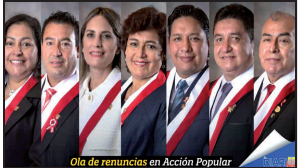
Ola de renuncias en Acción Popular

Alva y compañía solo han renunciado a la bancada, no al partido, por lo que no podrán juntarse y conformar un grupo parlamentario, según el artículo 37 del Reglamento Interno del Congreso. (PERU21,PE)