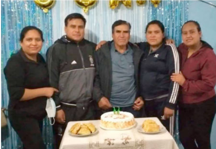
Esta nota es de dolor y sentimientos encontrados ante la irreparable pérdida no solo del amigo, sino por los valores que encarno durante su existencia como