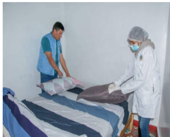
la atención a los visitantes y garantizar el cumplimiento de los requisitos. (MDI)

En vísperas de un feriado largo y con el objetivo de salvaguardar la salud y seguridad de los turistas que visitan Independencia, se llevó a cabo una visita inopinada a los establecimientos comerciales de hospedaje del distrito. Las autoridades presentes, la Fiscalía de Prevención del Delito, Indecopi, Dircetur, Policía de Turismo, y los inspectores municipales, realizaron las recomendaciones pertinentes para mejorar