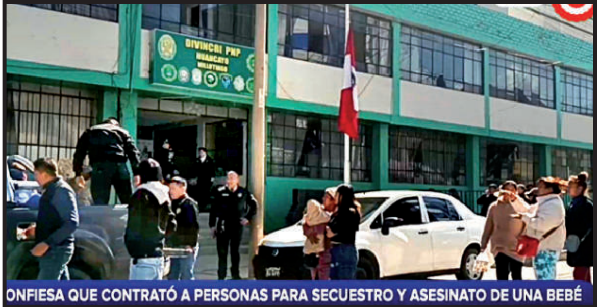
CONFESIA QUE CONTRATÓ A PERSONAS PARA SECUESTRO Y ASESINATO DE UNA BEBÉ

Se hacen las averiguaciones correspondien-