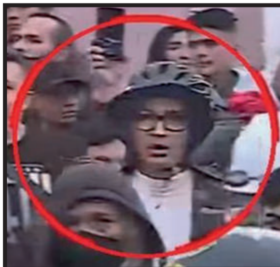
SE BUSCA. Sujeto que el 19 lanzó una molotov a la Policía y está prófugo.

-El acuerdo de Puente Piedra fue suscrito por el grupo 14N.