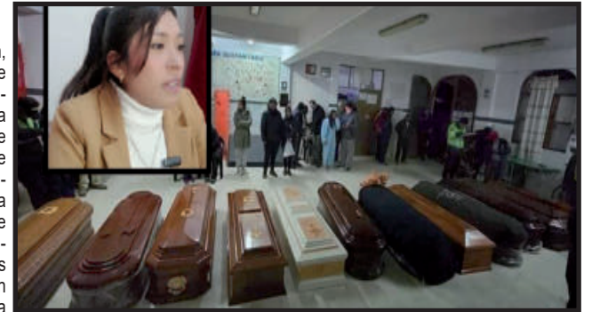
Uchusquillo, Pomallucay, Umanhuauco, hasta llegar al trágico lugar, 500 metros antes de la pista hacia Chacas. (Arnaldo Mejía Bojórquez)

El vehículo ya había transitado varios pueblos a partir de Yauya, Rosas