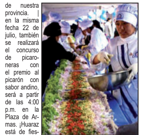
de nuestra provincia. En la misma fecha 22 de julio, también se realizará el concurso de picaroneras con el premio al picarón con sabor andino, será a partir de las 4:00 p.m. en la Plaza de Armas. ¡Huaraz está de fiesta! (Arnaldo Mejía Bojórquez)

Es más, el sábado 22 de julio, la población podrá degustar del cevicho huaracino de manera gratuita, desde las 10:00 a.m. en la Plaza de Armas de la ciudad, todo esto en el marco del 166 Aniversario