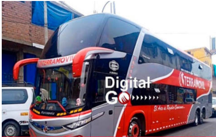
BUSS INTERPROVINCIAL ATROPELO Y MATÓ A UNA PERSONA EN PANAMERICANA NORTE - BARRANCA