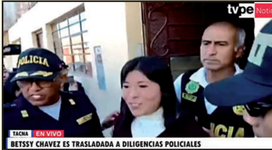
TACNA EN VIVO BETSSY CHAVEZ ES TRASLADADA A DILIGENCIAS POLICIALES

Defensa recurrirá al Tribunal Constitucional para revertir la situación legal de Betsy Chávez, debido a que ya no se puede presentar un recurso impugnatorio contra la decisión de la Sala Penal de Investigación Preparatoria.