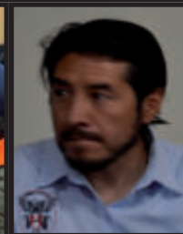
Quien más que los Guías de Huaraz de conocer la montaña,

do, en tal sentido desde Yungay los integrantes de la plataforma de Defensa Civil de la referida provincia, aunque de manera tardía se pusieron a trabajar.