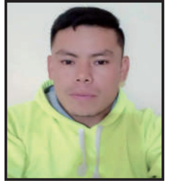
misaría Policial más cercana.