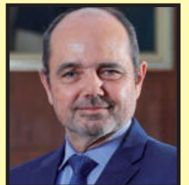
Ministro de Turismo Luis Fernando Helguero

"A través de este evento, buscamos encontrar alternativas que favorezcan el desarrollo turístico de Áncash, una región que cuenta con un importante potencial de crecimiento en este rubro debido a su rica historia, pueblos ancestrales y variada gastronomía. Estamos seguros de que este evento es el paso inicial para contribuir con ese propósito",