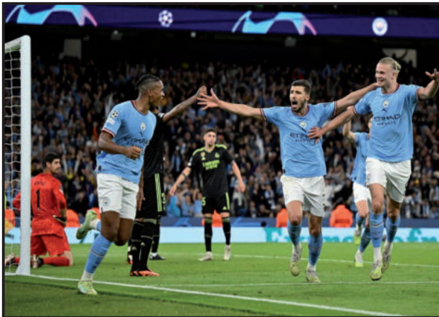
El Manchester City jugará la final de la Champions (10 de junio en Es-

Los ciudadanos se vengaron de la eliminación pasada y dejaron al Madrid sin la posibilidad de alzar su 'Orejona' número 15. Ahora, los de Guardiola van por su primera estrella en Liga de Campeones ante el Inter.