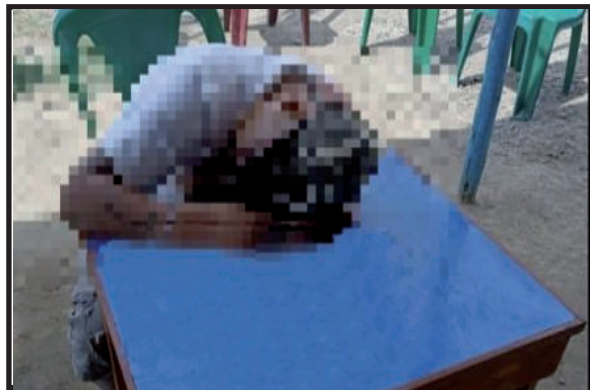
De dos disparos fue asesinado un hombre de 30 años de

edad en el interior de la cevichería “Canuto”, situada en el mercado Dos de Mayo, en Chimbote.