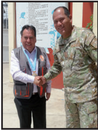
Personal de tropa limpiará calles y jardines

El pasado fin de semana faltaron escobas para poder limpiar varios sectores del distrito de Independencia como el bulevar "Pastorita Huaracina", esta acción ha sido saludada por los vecinos quienes también se unieron a la jornada de limpieza y solicitaron la continuidad de las mismas.