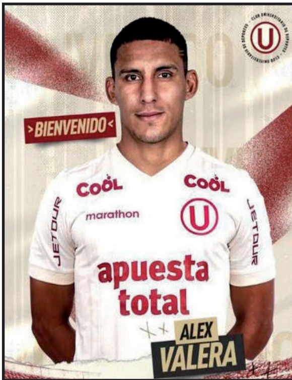
Sigue reforzándose. Universitario de Deportes aca-

A pocos meses de haber fichado por Al Fateh, el delantero fue confirmado por el cuadro crema como flamante fichaje para la Liga 1 2023.