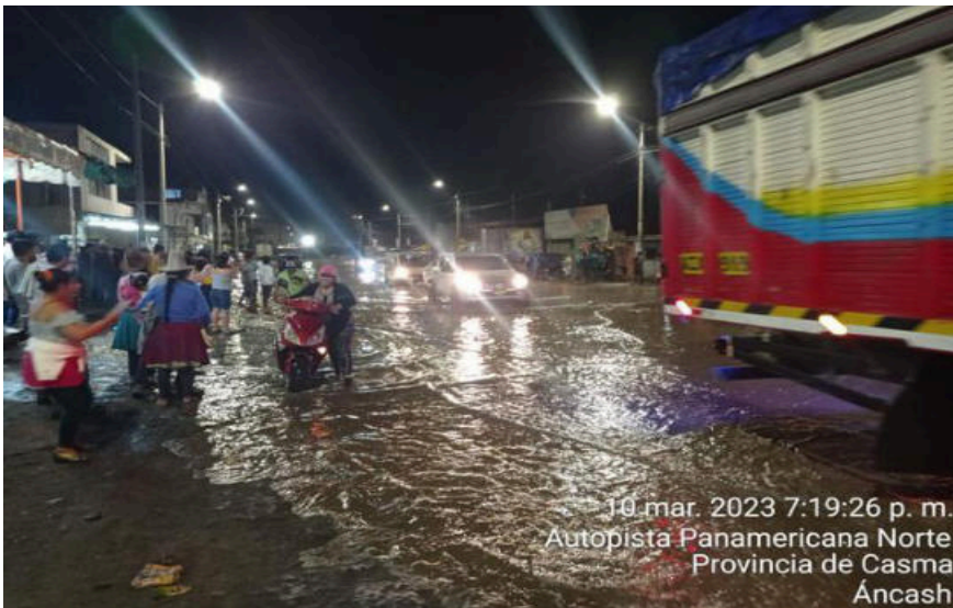
10.mar. 2023 7:19:26 p. m. Autopista Panamericana Norte Provincia de Casma Áncash